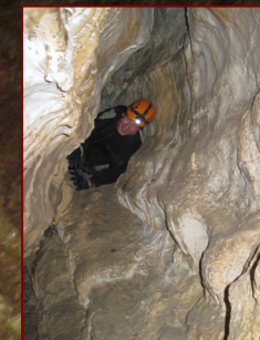
Колодец: вид снизу