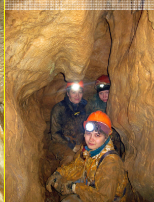
В последнем зале

Одежда выглядит немного по-другому, правда?