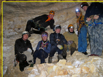
В первом зале

Одежда выглядит немного по-другому, правда?